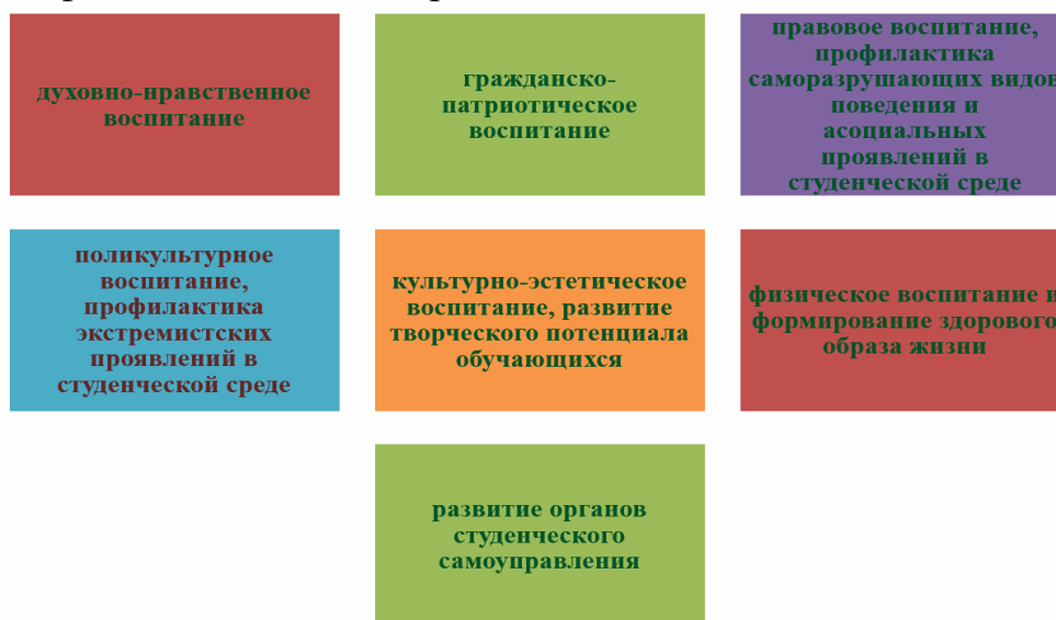
Рис. 5.1.1. Основные направления воспитательной деятельности СОФ НИУ «БелГУ»

Основные задачи и приоритетные виды деятельности воспитательной работы в рамках ОПОП представлены в рабочей программе воспитания по направлению подготовки/специальности и размещены в информационной системе «ИнфоБелГУ: Учебный процесс».