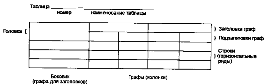
Рисунок 1 - Оформление таблицы

3.4. Таблицы, за исключением таблиц приложений, следует нумеровать арабскими цифрами сквозной нумерацией. Допускается нумеровать таблицы в пределах раздела при большом объеме монографии. В этом случае номер таблицы состоит из номера раздела и порядкового номера таблицы, разделенных точкой: Таблица 2.3 . Таблицы каждого приложения обозначают отдельной нумерацией арабскими цифрами с добавлением перед цифрой обозначения приложения: Таблица А.1 .